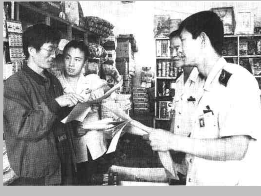
垦利县地税局胜坨分局在抓好税收工作的同时，经常向辖区营业户宣传税法知识，使业主们的纳税意识不断提高，从而保证了税收的增长。

广饶县地税局大王分局对停歇业户实行社会公开监督，以此减少虚假停歇业现象的发生。该局利用广播、电视和张贴公告等形式，定期向社会公开停歇业户的名称、地址、停歇业时间，设立监督台和举报电话，对主动检举虚假行为者给予奖励；对假停歇业的逃税者，依法处理，涉及税务人员管理责任的，按执法责任制追究。 (燕禹成)