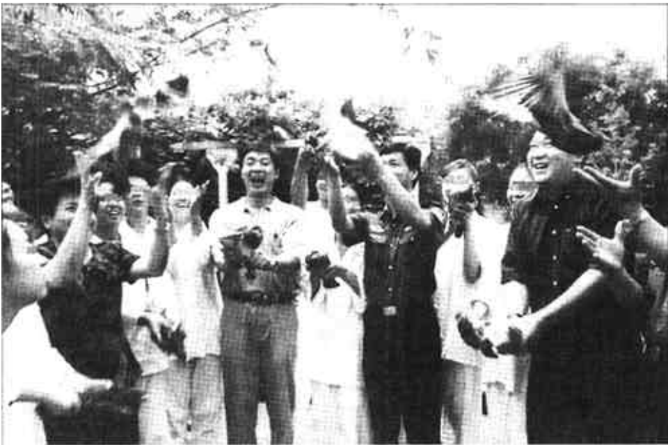
7月3日,北京市禁毒教育义务宣传员濮存昕和北京市青少年服务中心的工作人员来到市戒毒中心,看望这里的戒毒人员并给他们送来了戒毒教育书籍,鼓励他们坚持戒毒治疗,勇于战胜毒魔。这是在戒毒中心举办的“约会明天”主题活动中,濮存昕(前右三)和戒毒人员一起放飞鸽子。

处在暖期内;此外,冬季风明显偏弱和西北太平洋副热带高压明显增强,是这个冬季我国异常温暖的主要原因。 而环流异常则是我国造成气候异常的直接原因。4月中旬以来,东亚中高纬地区主要为负高度距平控制,西风带系统频繁,多弱冷空气活动,造成我国北方大部雨水较多;4月中旬至5月中旬,副高位置偏北是导致这期间华南雨水偏少的主要原因。而形成今年初夏(6月)我国降水分布的主要原因是:北方冷空气异常频繁,来自南方海上的暖湿气流十分活跃,冷、暖气流相互交汇才产生了大范围降水,但由于西北太平洋副热带高压位置不稳定、南北摆动比较大,从而使得6月份的全国降水表现出雨带南北摆动,多局部暴雨等主要特征。