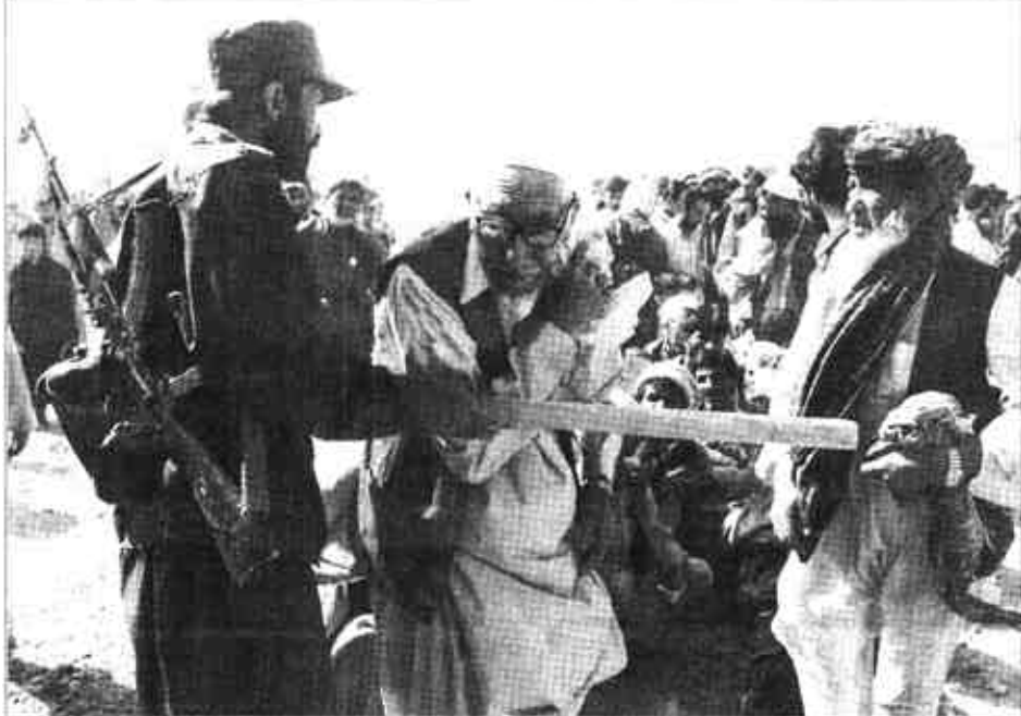
7月3日,在联合国难民署驻喀布尔的粮食分发中心,一名阿富汗警察让这位戴着眼镜的老人耐心等待领取粮食。在联合国难民署的帮助下,已有大约110万难民返回了他们在阿富汗的故乡,但仍有约400万阿富汗人流亡在国外,他们主要居住在巴基斯坦、伊朗和其他70多个国家。

向该委员会递交了一份解释报告。但是,这份报告遭到证监会主席哈维·皮特的批驳。皮特认为报告的内容很“不充分”,没有把问题说明白。 世界通信公司25日承认,该公司去年和今年第一季度将总额达38亿美元的运营开支错误地记到了资本开支帐户上,使公司这一期间的经营业绩由亏损转为赢利。这已成为迄今美国最大的财会丑闻之一。