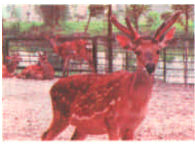
在江苏省江阴兴澄钢铁有限公司，建有一个野生动物园，2001年，兴澄钢铁有限公司的18项排放指标全部达到国家标准，该公司动物园饲养的动物繁殖率达到了30%。