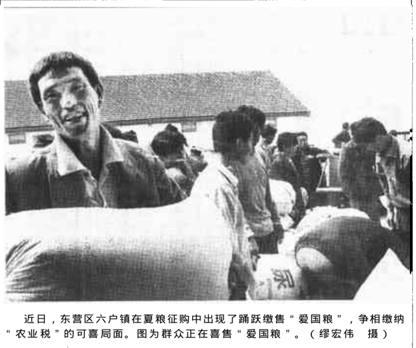
近日，东营区六户镇在夏粮征购中出现了踊跃缴售“爱国粮”，争相缴纳“农业税”的可喜局面。图为群众正在喜售“爱国粮”。

制定了住宅小区卫生保洁制度，由专人负责小区内道路、绿地及公用楼道的定时清扫，保持全日清洁。小区内实施绿化种植规划，种植草坪6.67万平方米、各类花木10万余株，并进行了大色块、拼图案的模纹种植，带状绿地与块状绿地相互贯通、相互渗透，并由专职人员负责小区绿化的浇水、施肥、修剪等工作，使植被成活率达100%，切实提高了景观效果和绿化质量，满足了居民休息、锻炼和儿童游乐的需要，为广大居民的生活营造了一个舒适优美的环境。(丁莉 赵兰)