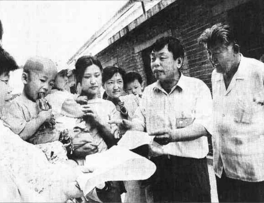
东营区黄河路街道办事处借我市建设“信用东营”的有利时机,在社区内广泛开展了做“信用市民”活动。图为该办事处燕北社区粮店小区的楼长为居民们讲解“东营市市民信用公约”。